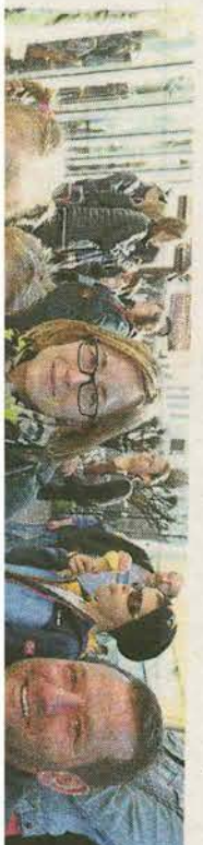
Das gute Wetter kam nicht nur den Ladengeschäften und den Marktschreibern entgegen, auch die Eisdiele profitierten vom strahlenden Sonnenschein. V