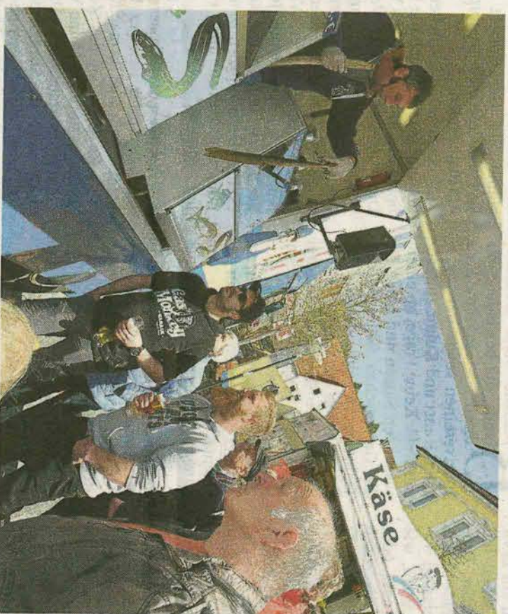
Auf dem bungenmarkt die Händler lautstark Waren hier zu Spielgäheren

Anlässlich des Fischmarkts öffneten gestern die Albstädter Einzelhändler beim verkaufsoffenen Sonntag ihre Türen. Obwohl die Passanten bei einem der ersten warmen Frühlingstage des Jahres lieber draußen auf den Terrassen der Cafés saßen, profitierten auch die Albstädter Kaufleute von den Menschenmassen in der Innenstadt.