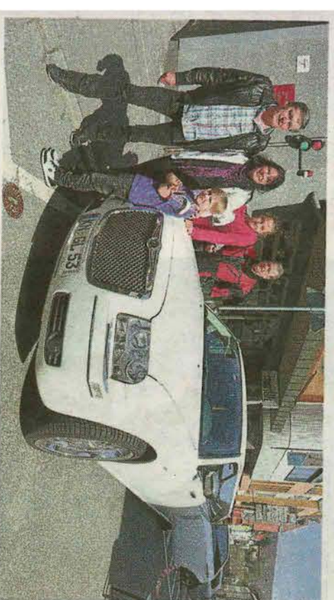
Beim Frühlingfest im Cityhaus in Ebingen konnten die Besucher eine Runde mit einer Stretchlimousine durch die Stadt drehen.